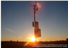
Informacija iš keliuose atbradusių eismo intensyvumo ir oro sąlygų matuoklių pateiks įsukurtą sistemą – centrą.

Informacinės visuomenės pranašumai kol kas sunkiau prieinami Lietuvos kaimų ir miestelių gyventojams dėl labai paprastos priežasties – nėra plačiajuosčio interneto prieigos. Antroji prioriteto „Informacinė visuomenė visiems“ kryp-