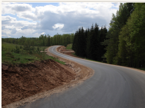
Praejuosiais metais išasfaltuota daugiau kaip 400 km žvyrkelių.

O kiek transporto problemų buvo išspręsta Vilniuje nutiesus Pietinį aplinkkelį? Grūčių iš karto sumažėjo. Kai ryte reikia mažiau laiko praleisti spūstyse, sutaupoma ir laiko, ir degalų, ir aplinkai mažiau kenkiama.