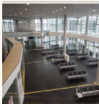
ES lėšomis renovuoti Lietuvos oro uostai

oro sąlygomis lėktuvus galima saugiau priimti.