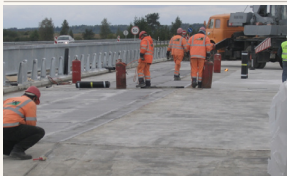
Šiemet toliau bus vykdomi aplinkelių projektai ne tik Vilniuje ir kituose didžiauosiuose Lietuvos miestuose, bet ir mažesniuose miesteliuose.