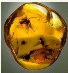
Lankytojai nekantrauja, ką įdomaus pasiūlys naujoji muziejaus ekspozicija.

Nuo praėjusių metų rudens tvarkoma ir istorinė Botanikos parko dalis. Renovuojami praeisaušios būklės objektai: takai, Birutės kalno laiptai, parko laistymo sistema. Šiems darbams skirta apie 3,5 mln.