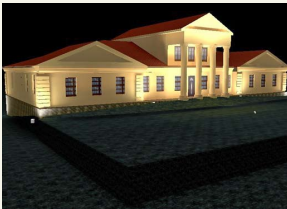
Taip atrodytų rekonstruotas Dūkšto dvaras.

teigti, jog Dūkšto dvaro sodyba potencialiai gali tapti svarbiu kultūros ir turizmo traukos centru Ignalinos rajone. Tam reikia sėkmingai įgyvendinto projekto. „ES struktūrinių fondų parama užtikrins, kad per ateinančius mėnesius projektas bus visiškai įgyvendintas ir dvaro sodyboje bus teikiamos įvairios aukštos kokybės turizmo ir poilsio paslaugos, t. y. apgyvendinimo, maitinimo, konferencijų,