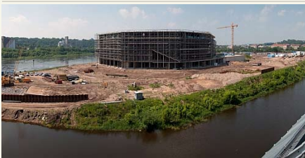
Statoma Kivano arena bus konkurencinga visame Rytų ir Vidurio Europos regione.