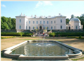
Gintaro muziejuje renovuojami praeitiesios būklės objektai: taktai, botanikos parkas.

Didelis lankytojų srautas kelia muziejui naujus iššūkius, skatina atnaujinti muziejaus infrastruktūrą ir gerinti teikiamų paslaugų kokybę. Dėl šios priežasties muziejaus rekonstrukcijai buvo skirta