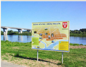
Jurbarko rajone gausu lankytinų objektų.

Įgyvendinus projektą iš esmės pasikeitė Jurbarko miesto dalies prie Nemuno vaizdas. Buvo sutvarkyta teritorija nuo paplūdimio iki Mituvos mažųjų laivelių prieplaukos: įrengtas paplūdimys, aktyvaus poilsio aikštelės, nutiesti dviračių