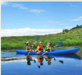
Baidarėmis Dubysa nuo šiol galės leisti dar daugiau poilsiautojų.

Viskas pamažu keičiasi įgyvendinant Europos Sąjungos (ES) struktūrinėmis lėšomis remiamą projektą „Dubysos upės gamtinių išteklių panaudojimas turizmo plėtrai Raseinių ir Kelmės rajonuose“.