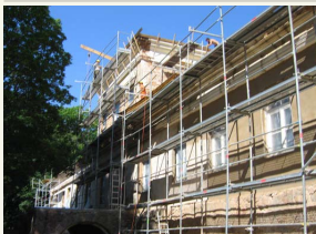
Taip dabar atrodo rekonstruojamas Dūkšto dvaras

Aplinkui – didelis XIX a. pradžioje įveistas