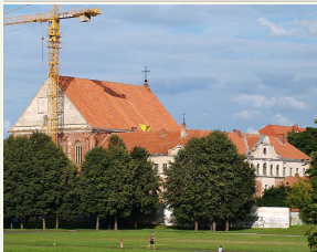
Rekonstruojamas Kauno Bernardinų vienuolyno ir Šv. Jurgio Kankinio bažnyčios kompleksas pirmiausiai priims religinius piligrimus.

„Pirmame ir antrame aukštuose stengsimės išlaikyti autentišką – ten ir lūks vienuo-