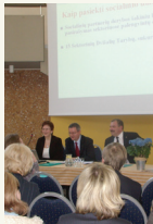
Projekto „SEDIWA“ (Sektorinių dialogų tarybų steigimas bei jų veiklos intensyvinimas), kurį vykdė Lietuvos profesinių sąjungų konfederacija, siekiama ugdyti darbo įmonės kompetenciją ir gebėjimą prisitaikyti prie pokyčių.

šarbdavys ar darbdavių organizacija, partneriais projekte gali būti profesinės sąjungos ar jų išvienijimai. Auk tik bendras darbas ir problemų išspindimas kartu užtikrins projekto sėkmę. Potencialiems pareiškėjams ministerijos atstovė išdėstė atkreipti dėmesį į uždienio valstybių žerąją praktiką, siekiant skatinti socialinę partnerystę, bei į Lietuvos įmonėse įkurtų laugaus ir sveikatos komitetų veiklos rezultatus.