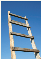
Ilgesnis paraiškų teikimo terminas – kelias į naujas galimybes.

„Visų pirma ilgas paraiškų teikimo terminas padeda užtikrinti efektyvų ES struktūrines paramos lėšų panaudojimą. Taip pat pradėję taikyti gerokai ilgesnius paraiškų teikimo terminus tikimės dar didesnio įmonių susidomėjimo ES struktūriniu parama. Tai būtų tarsi savotiška motyvacijos priemonė mūsų įmonėms, išgyvenančioms ne patį lengviausią periodą. Tikime, kad aiškus paramos teikimo laikotarpio įvardijimas ir ilgalaikis paraiškų priėmimas leis įmonėms geriau susiplanuoti struktūrines paramos poreikį,