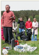
„Visuomenės informavimo projekto “Vandens išteklių išsaugojimas atliekų kurtams“ sieks sudarinti visuomenės pamoką domėtis vandens išteklių būkle ir jų prieština.

It viso šiai priemonei numatoma skirti 11 mln. litų Europos regioninės plėtros fondo lėšų. Pagal šią priemonę bus finansuojami projektai, kurių vertė – nuo 100 iki 500 tūkst. litų.