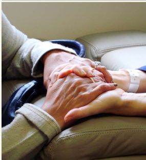
Projektas siekia spręsti socialines problemas.

Jau penktus metus veikiantis Joniškio socialinių paslaugų ir užimtumo