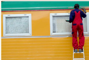
Vietieji darbai mažina bedarbių gretas.

Tauragės rajono Darbo biržos Užimtumo rėmimo įgyvendinimo skyriaus