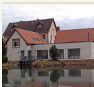
Nemuno kilų regioninio parko lankytojų centras.

2005–2008 m. laikotarpiu saugomų teritorijų planavimui ir tvarkymui