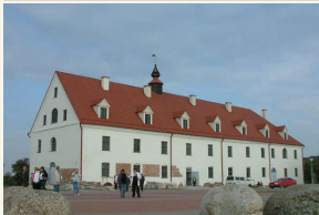
Lankytojai kviečiami užsukti į atnaujintus istorinius Kražių kolegijos pastatus.

Kolegijos teritorijoje buvo pastatyti net 24 įvairios paskirties pastatai: vienuolyno ir kolegijos pastatas, bažnyčia – puošniausia to meto Žemaitijos šventovė, mokykla, ūkiniai pastatai, mūrinis malūnas, alaus darykla ir t.t. 1773 m. jėzuitai iš Kražių išsikėlė, tad pastatai buvo apleisti, keitėsi jų savininkai. Kai kurie statiniai buvo nugriauti, o pietinį korpusą išnuomojo gyventojams ir įstaigoms. Per karus sugriauta Kolegijos