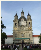
Kauno Šv.Čausiosos Mergelės Marijos Apšalinimo bažnyčia Pažaislyje, Kauno marių pusiasalyje – vienas geriausių brandžiojo baroko pavyzdžių regione.

Paugavus ir pagrybavus prie Kauno marių prigludusiuose miškuose, pasi-vaikščiojus palei stačius marių šlaitus, verta aplankyti ir regioninio parko kultūros paveldo objektus. Svarbiausias – Pažaislio vienuolyno ansamblis, vadinamas XVII a. Lietuvos baroko perlu. Ansamblio pastatuose, kurie pripažinti