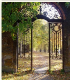
Vandeningam pasivaikščiavimui po parką – specialiai įrengti takeliai.

Už paramos lėšas buvo restauruotas centrinių rūmų fasadas, dalis vidaus salių, rūmus supanti teritorija, įrengti inžineriniai tinklai, sutvarkytos Kruojos upės atkarpos, priklausančios dvaro sodybos teritorijai – išvalyti tvenkiniai, įrengti lieptai, suformuotos salelės, nutiesti pėsčiųjų takai. Rekonstruotuose ūkiniuose pastatuose numatyta vykdy-