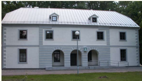
Pietinėje dvoro oficineje įsikūrė turistams informacijos centras, įvengta konferencijų salė.

Neseniai restauruota pietinė dvoro oficina – joje įsikūrė turizmo informacijos