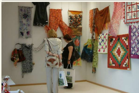
Kražių M.K. Sarbievijaus kultūros centre organizuojamos parodos ir kiti renginiai.

bažnyčia, Profesorių namas, išlikusiam pastate sovietinės okupacijos metais buvo įrengti butai.