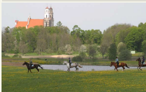
Kurtuvėnų regioninio parko Jojimo paslaugų centre galima užsisakyti jojimo pamoką, įdėnįjant neigiamai parakikalis parko valdais.

Daugiau informacijos rasite čia www.kurtuva.lt