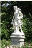
Originaliame dvare parke atkurta nemaža dalis skulptūrų.