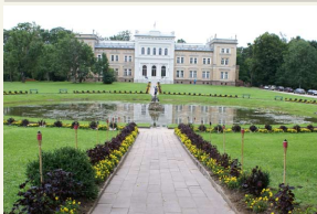
Autentiškai rekonstruotas dvaro pastatas ir jį supanti aplinka praeities kultūros dvasia.

Plungės Oginskių dvaro ansamblis pasirošęs priimti lankytojus, kuriems galėtų patraukliai pristatyti unikalią istorijos, kultūros ir gamtos paveldą.