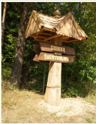
Kurtuvėnų regioninio parko informacinė rodyklė.

Be to, šalia dvaro esančiose arklidėse įkurtas Jojimo paslaugų centras, kuriame profesionalūs treneriai organizuoja kelių valandų, kelių dienų žygius, savaitgalius ar visas atostogas su žirgais. Nepasiklysti, lengvai rasti lankytinus objektus šiame regioniniame parke padės ES struktūrinių fondų lėšomis įrengta informacinė sistema.