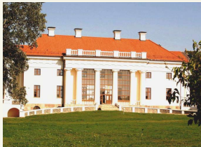
Restauruoti centriniai rūmai, dvaro sodybos teritorija.

Už ES struktūrinių fondų ir valstybės lėšas, kurios sudarė apie 12,8 mln. litų, buvo restauruoti ir turizmo reikmėms pritaikyti Pakruojo dvaro sodybos centriniai rūmai bei šiaurinėje dvaro sodybos dalyje esantys keturi ūkiniai pastatai – vandens ir vėjo malūnai, malūnininko namas, smulkė.