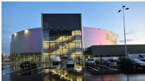
Panevėžio Cido arena.

Panevėžys puikiai pasiruošęs 2011 m. Lietuvoje vyksiančiam Europos vyrų krepšinio čempionatui – mieste pastatyta universali daugiafunkcė arena, kurioje gali tilpti iki 7 tūkst. žiūrovų.