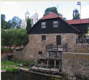
XIX a. Mosėdžio vandens malūnas ir jame įkūręs respublikinis V. Iro akmenų muziejus, Tolamoje – Mosėdžio šv. Arkangelo Mykalo bažnyčia.

se auga retų rūšių augalai, o didžiausias regioninio parko pasididžiavimas – vieni gražiausių ir itin saugomų Lietuvos paukščių – griezlės ir tulžiai. Panau-