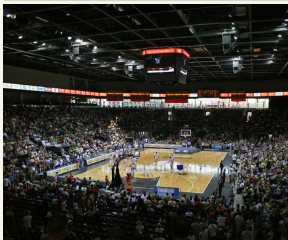
Šiaulių krepšinio klubo namų aikštėje telpa daugiau nei 7 tūkstančiai žiūrovų.

Dainių parke įsikūrusiame universaliame sporto, kultūros ir laisvalaikio komplekse gali būti rengiamos krepšinio, futbolo, rankinio, teniso ir net ledo ritulio varžybos. Čia įrengtos sporto treniruočių salės, todėl arena tapo namų aikšte „Šiaulių“ krepšinio klubui. Taip pat arenos patalpose įsikūrė sporto mokyklos, klubai, sveikatingumo ir grožio centras, trenerių klubai, aerobikos klubai, sporto medicinos kabinetas, kavinės, barai, restoranai, suvenyrų parduotuvė ir Sporto muziejus.