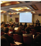
Vilniuje vykusio tarptautinio konferencija „ES struktūrinės paramos vertinimas: siekiant kokybės ir rezultatų naudojimo“ pritarė daugumą nei 100 Lietuvos, kitų ES šalių narių pareigūnų, Europos Komisijos atstovų, ekspertų.

Vienas veiksmingų būdų užtikrinti, kad ES struktūrinių fondų remiamos programos būtų vykdomos efektyviai, skaidriai ir siekiant geriausio rezultato, yra vertinimas. Lietuvoje ši priemonė taikoma dar gana neseniai, tačiau jos naudingumas nekelia abejonių. Ne tik todėl, kad vertinimas prisideda prie ES struktūrinės paramos programų įgyvendinimo kokybės, bet ir todėl, kad vertinimas – veiksmingas būdas didinti viešojo sektoriaus efektyvumą.