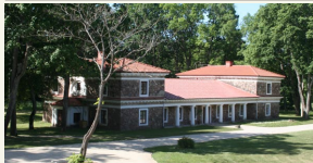
Rokiškio dvaro pietinė oficina.

Rokiškio dvaro ansambly sudaro šešiolika išlikusių pastatų, jį supa parkas ir tvėnkiniai. Dvare įrengtas Rokiškio krašto muziejus, čia ekspozuojami grafų daiktai ir net drabužių kolekcija.