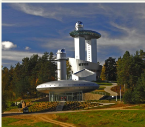
2008 m. nudenėj ES struktūrinių fondų lėšomis rekonstruotas muziejus pastatas.

Miškuose netoli Moletų įsikūręs „kosminį laivą“ primenantis centras ir tiesų yra ir Lietuvoje, ir pasaulyje unikalus etnokosmologijos muziejus.