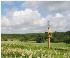
Nuotrauka Tytuvėnų regioninio parko kraštovaizdis.

Prieš įgyvendinant priemonės „Viešojo turizmo infrastruktūra ir paslaugos“ projektą, naudinga informacija apie šį traukos centrą nebuvo lengvai prieinama. Dabar