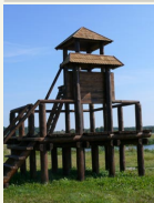
Aukštaitijos nacionalinio parko paviljono stebėjimo bokštelis Žemaitiškių pievose.

• Biržų regioninis parkas. Šiaurės Lietuvos regioninis parkas didžiuojasi unikaliu geologiniu reikškimu – smegduobėmis. Kai kuriose jų susidariusios ES saugomos buveinės – gipso karsto ežerai. Tik jame galima išvysti įspūdingą bastioninio tipo pilį, pasigėrėti Astravo rūmais.