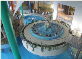
Druskininkų vandens parko vandens pramogų centras – 9000 kv. m. plotas, kurį sudaro nusileidimo kalnelių bokštas ir jo juodąjį kupolą esanti baseinų zona.

Pasitelkiant ES lėšas pastatytas didžiausias Rytų Europoje Druskininkų vandens parkas kviečia apsilankyti pirčių komplekse, baseinuose, šuoželti nuo nusileidimo kalnelių, atsipaaiduoti sūkurinėse voniose ir pasimėgauti kitais vandens teikiama malonumais.