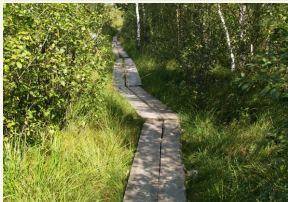
Aukštaitijos nacionalinio parko paviljono stebėjimo bokštelis Žemaitiškių pievose.

Pasižvalgykite po autentiškus kaimus, aplankykite įymiąją Palūšės bažnyčią, gėrėkitės kvapą užimančia septynių ežerų panorama nuo Ladakalnio, lyžtelkite šviežutėlio medaus Bitininkystės muziejuje. Visa tai ir dar daugybė pramogų bei įdomybių laukia nacionaliniame parke, vis geriau pasirengusiame priimti lankytojus be žalos vertybėms.