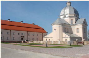
XVII a. architektūrinis Liškiaivos ansamblis – pietų Lietuvos baroko pažiba, gausiai lankoma turistų iš viso pasaulio.

Nepaliestos gamtos apsuptyje, ant Nemuno kranto netoli Druskininkų įsikūręs Liškiaivos vienuolyno ansamblis vėl laukia lankytojų iš Lietuvos ir kitų kraštų. Prieš keletus metus ES fondų lėšomis sutvarkyta vienuolyno ir bažnyčios aplinka, todėl svečių kasmet sulaukiama vis daugiau.