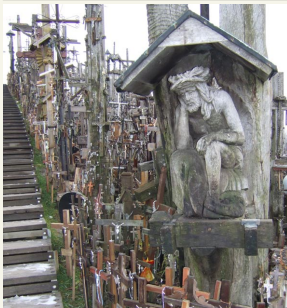
Šandien čia tarsi per 200 tūkstančių kryžių ir kryželių.

veikia turizmo informacijos centras, pastatytas turistų aptarnavimo pastatas, įrengtos automobilių ir autobusų aikštelės.