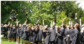
Paragauz jungtinės programos, studijos bus vykdomos kelių šalių aukštojo mokykloms.

Taigi jau šį rudenį ministerija aukštąsias mokyklas pakvies dalyvauti jungtinių studijų programų rengimo, pasinau-