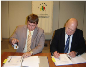
Parašytos sutartys pagal priemonę „Žmogiškųjų išteklių tobulinimas viešajame sektoriuje“.

tobulinimas viešajame sektoriuje“. Pagerėjusios viešojo sektoriaus darbuotojų kvalifikacijos kokybę pajus kiekvienas Lietuvos gyventojas. Medikai, atnaujinę turimas žinias, galės greičiau diagnozuoti ligas, o bibliotekų darbuotojai nuo šiol suras ne vien tik reikiamą knygą lentynoje, bet ir supažindins su