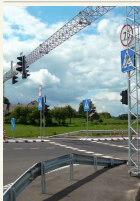
Neseniai baigtas rekonstruoti kelio Vilnius–Utena ruožas.

„Kelio rekonstrukcija užtikrino patogią jungtį su magistrale Vilnius–Kaunas–